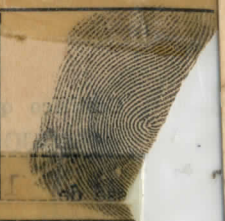
(Impressão polegar direito)

DIRETORIA DO PESSOAL B.F. 80 Quartel de Martinheiros, 8 de dezembro de 1964